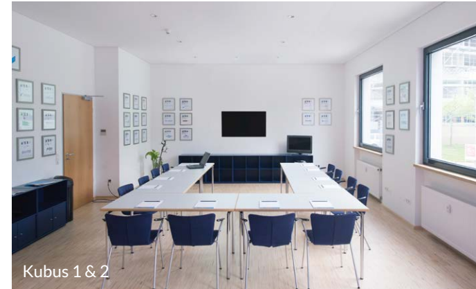
Kubus 1 & 2